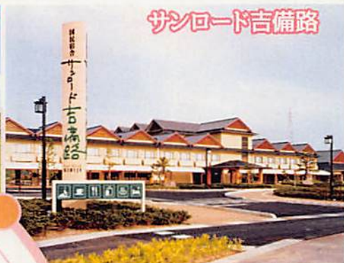
サンロード吉備路