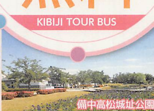
備中高松城址公園