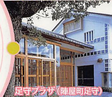
足守プラザ(陣屋町足守)